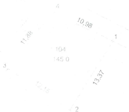
bảng sơ đồ thửa đất