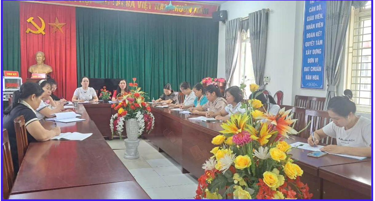
Hình ảnh 1: Họp chuyên môn đầu năm thống nhất kế hoạch giáo dục tích hợp VHCC

Minh chứng giải pháp 1: Tham mưu xây dựng kế hoạch chỉ đạo thực hiện nhiệm vụ năm học gắn liền với nội dung tích hợp VHCC