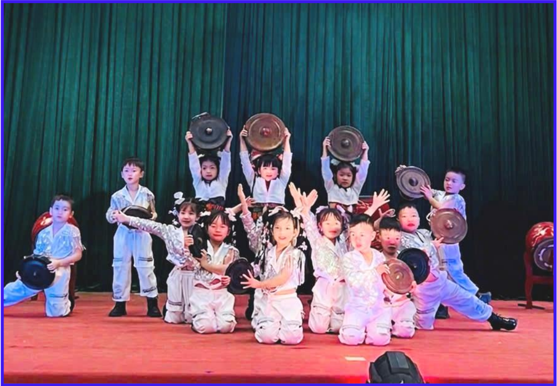
Hình ảnh 19: Trẻ tham gia biểu diễn với cồng chiêng trong một tiết mục nhảy hiện đại