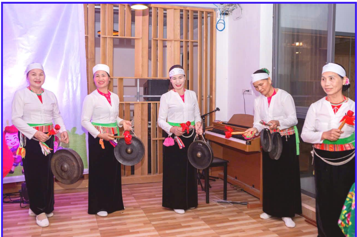
Biểu diễn ở khu du lịch sinh thái