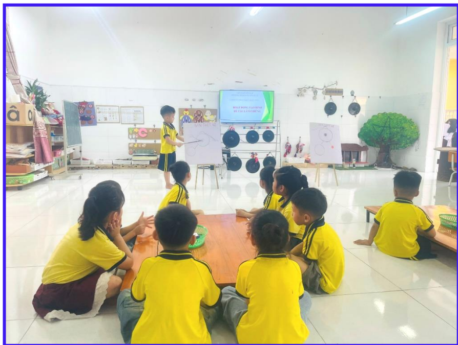
Hình ảnh 7: Trẻ tham gia hoạt động steam làm Chiêng của lớp 5 tuổi A2