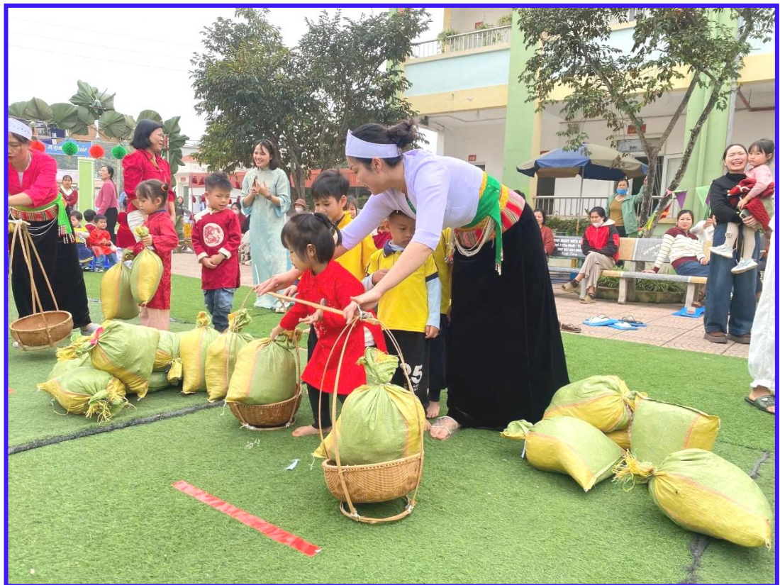
Hình ảnh 18: Phụ huynh tham gia cùng con trong chương trình “Xuân gắn kết tết yêu thương”.