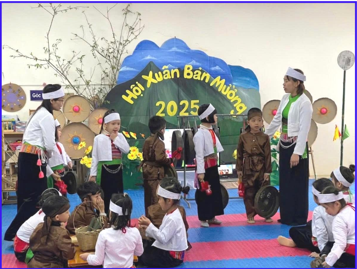
Hình ảnh 10: Trẻ hoạt động khám phá bản sắc văn hóa Mường