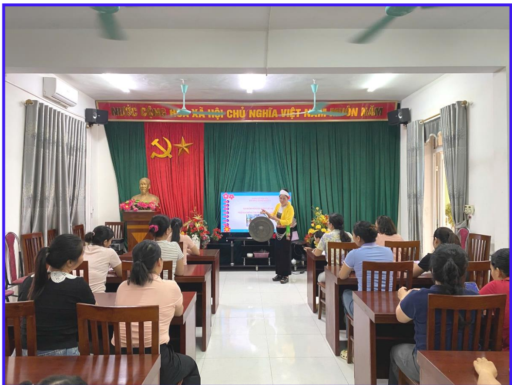
Hình ảnh 4: Tọa đàm với giáo viên về nội dung “Tiếng chuông trong tâm hồn trẻ thơ”

Minh chứng giải pháp 2: Bồi dưỡng năng lực chuyên môn cho giáo viên về tích hợp nội dung VHCC vào hoạt động giáo dục mầm non