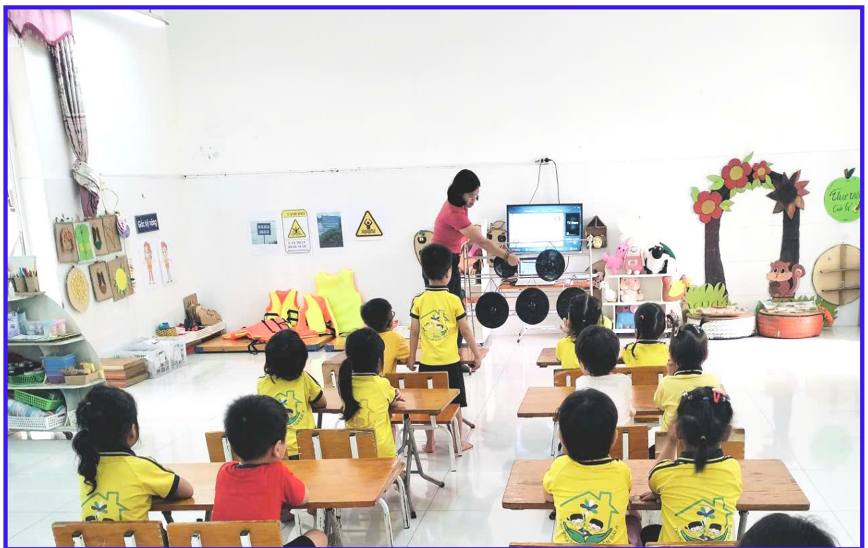
Hình ảnh 9: Cô sử dụng công chiêng để tổ chức hoạt động làm quen với toán thêm bớt trong phạm vi 5 lớp 3-4 tuổi C1.