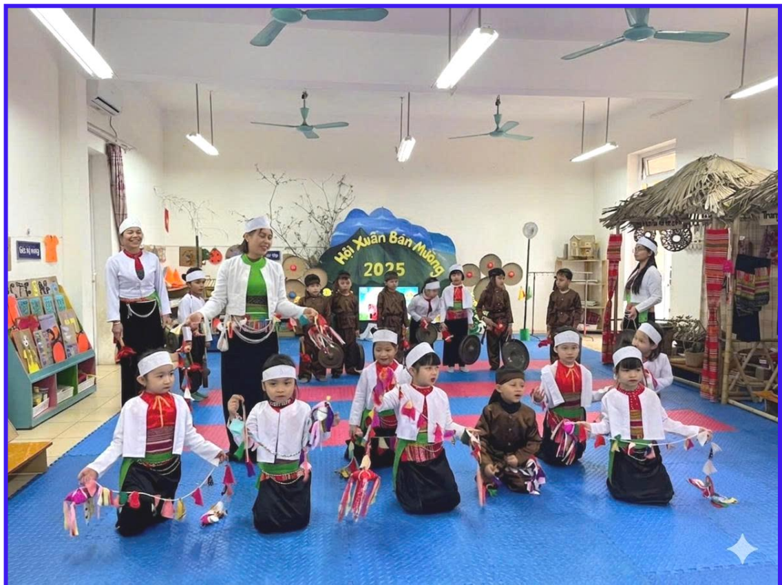
Hình ảnh 20: Trẻ biểu diễn chiêng trong chương trình văn nghệ