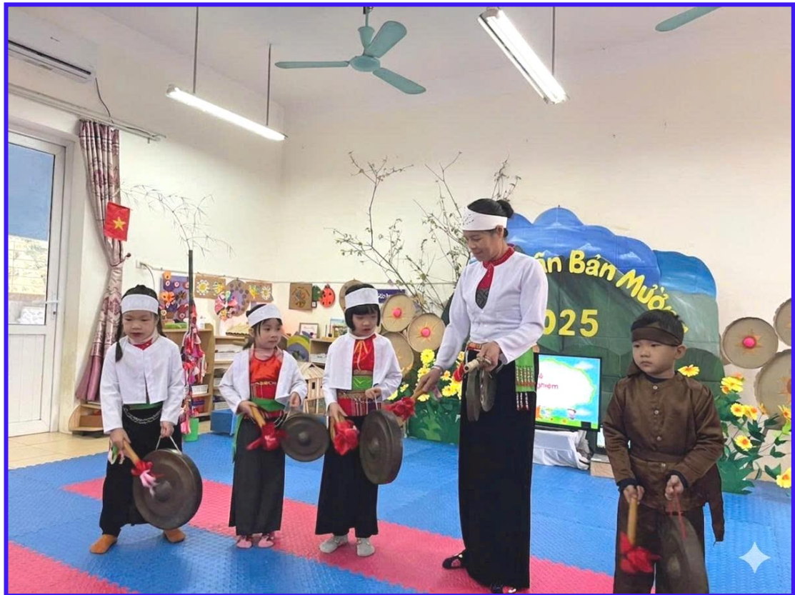
Hình ảnh 17: Nghệ nhân tham gia hoạt động dạy trẻ tìm hiểu VHCC và trải nghiệm đánh chiêng