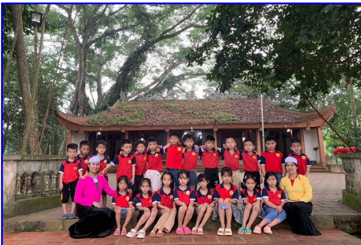
Hình ảnh 11: Trẻ tham gia lễ hội ở thôn, thăm quan đình làng Quýt