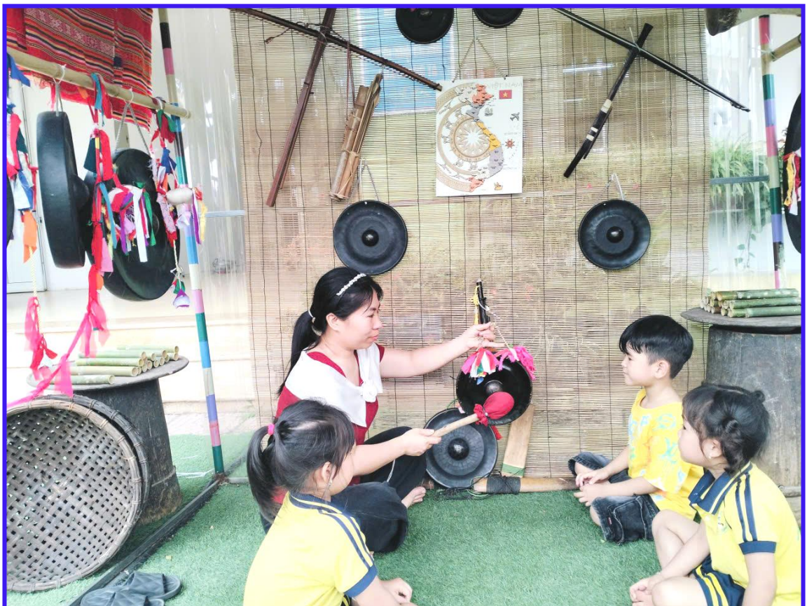
Hình ảnh 13: Trẻ chơi và khám phá gian chợ văn hóa