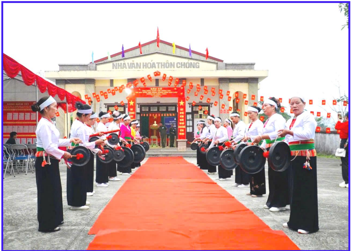
Biểu diễn trong buổi khai mạc bầu cử