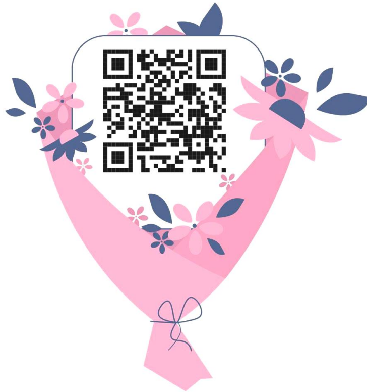
Mã QR kế hoạch giáo dục tháng của 4 khối lớp

Minh chứng giải pháp 2: Bồi dưỡng năng lực chuyên môn cho giáo viên về tích hợp nội dung VHCC vào hoạt động giáo dục mầm non