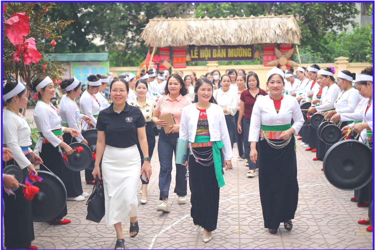
Hình ảnh 2: Giáo viên tham gia tập huấn chuyên đề tại trường Mầm non Trung tâm nghiên cứu Bò và đồng cỏ Ba Vì chủ đề Lễ hội bản Mường