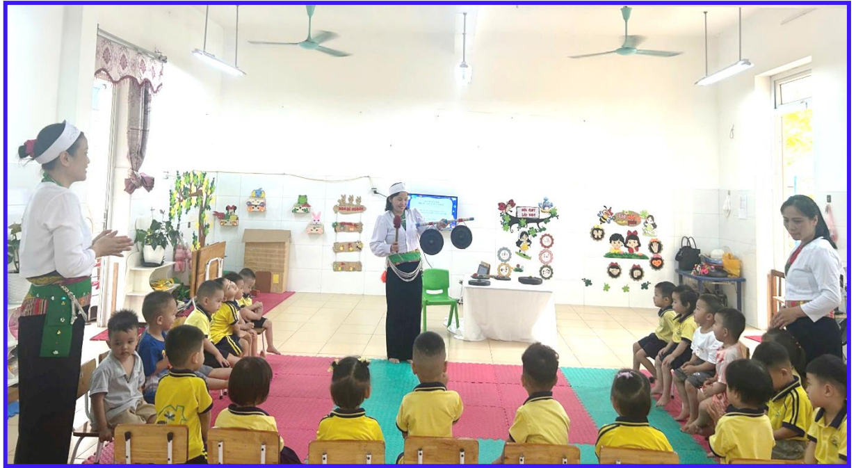
Hình ảnh 8: Cô và trẻ tham gia hoạt động nhận biết công chiêng lớp Nhà trẻ D1