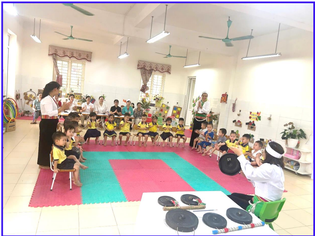
Hình ảnh 12: Giáo viên dự giờ đồng nghiệp trong hoạt động tích hợp VHCC theo hướng nghiên cứu bài học tại lớp nhà trẻ