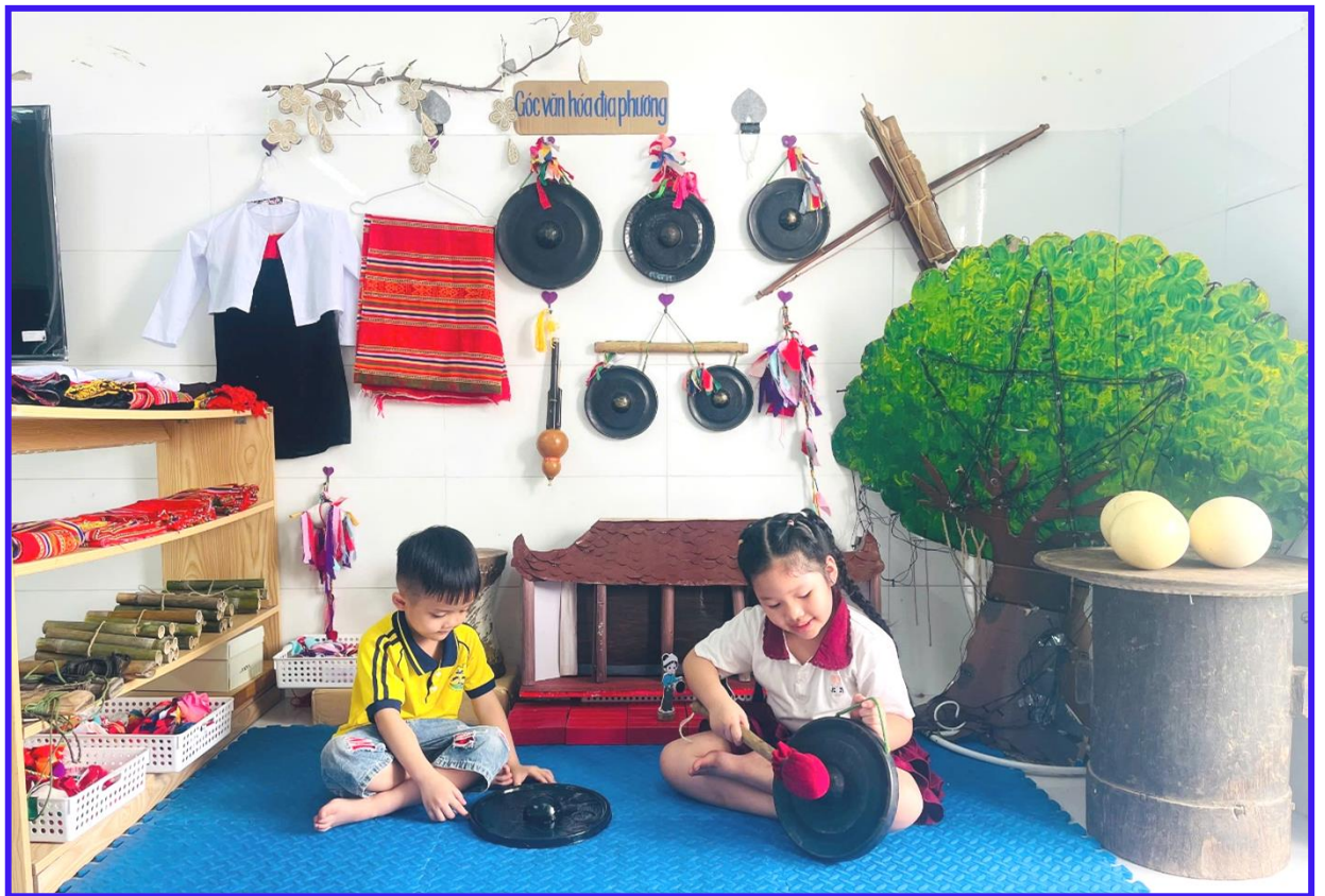
Hình ảnh 14: Góc văn hóa địa phương, góc steam (công chiêng)