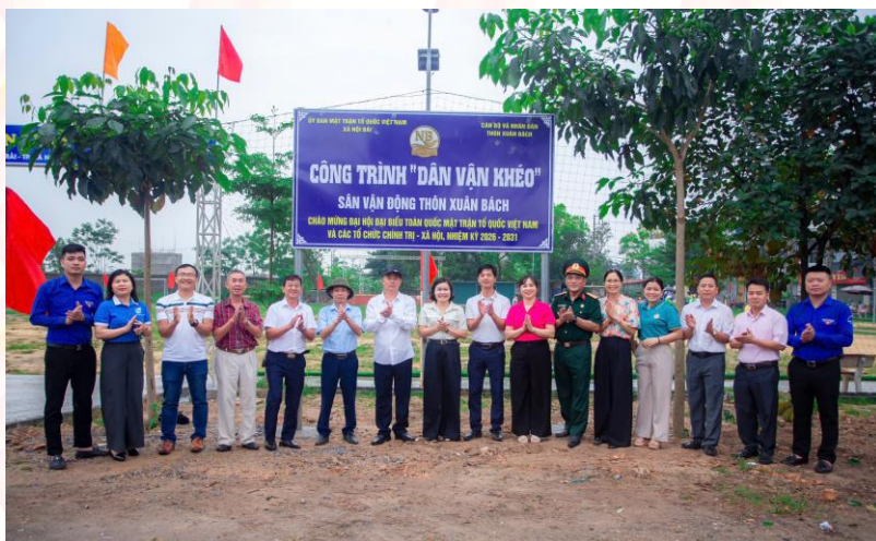
Gắn biển công trình Dân vận khéo tại thôn Xuân Bách

Ngày 21/5/2026, Đảng ủy xã ban hành Kế hoạch số 51-KH/ĐU thực hiện Chỉ thị số 10-CT/TU ngày 25/3/2026 của Ban Thường vụ Thành ủy Hà Nội về nâng cao chất lượng, hiệu quả phong trào thi đua “Dân vận khéo” trong tình hình mới trên địa bàn xã Nội Bài. Kế hoạch hướng tới đổi mới phương thức dân vận theo hướng "gần dân, sát dân, trọng dân", giải quyết kịp thời các vấn đề bức xúc từ cơ sở; gắn chặt với nhiệm vụ chính trị của xã và lấy mức độ hài lòng của nhân dân làm thước đo đánh giá.