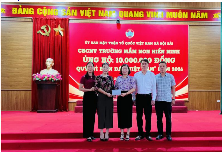
Ủy ban MTTQ Việt Nam xã tiếp nhận ủng hộ

Thực hiện Kế hoạch số 63/KH-MTTQ-BTT ngày 11/4/2026 của Ban Thường trực Ủy ban MTTQ Việt Nam thành phố Hà Nội về tổ chức vận động ủng hộ Quỹ “Vì biển, đảo Việt Nam” thành phố Hà Nội năm 2026, ngày 13/4/2026, Ban Thường trực Ủy ban MTTQ Việt Nam xã Nội Bài ban hành Kế hoạch số 39/KH-MTTQ-BTT về tổ chức vận động ủng hộ Quỹ “Vì Biển, đảo Việt Nam” năm 2026 trên địa bàn xã Nội Bài.