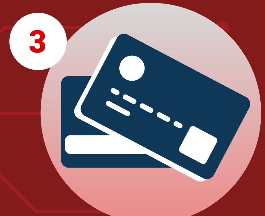
3 Thanh toán