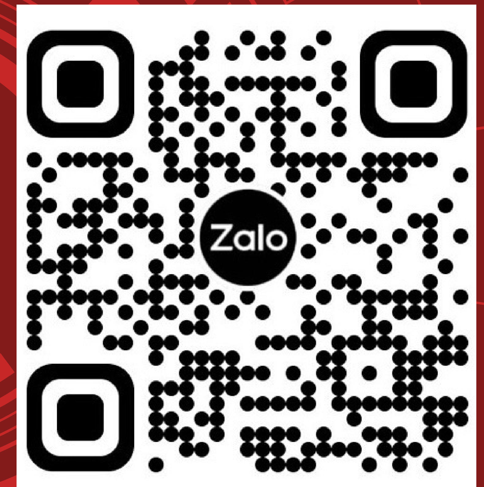
ZALO OA UBND PHƯỜNG THANH XUÂN