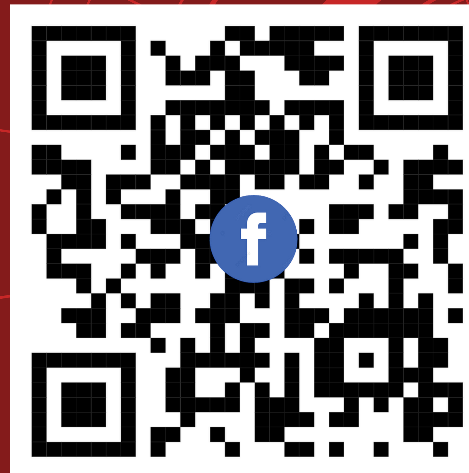
FACEBOOK THANH XUÂN NGÀY MỚI