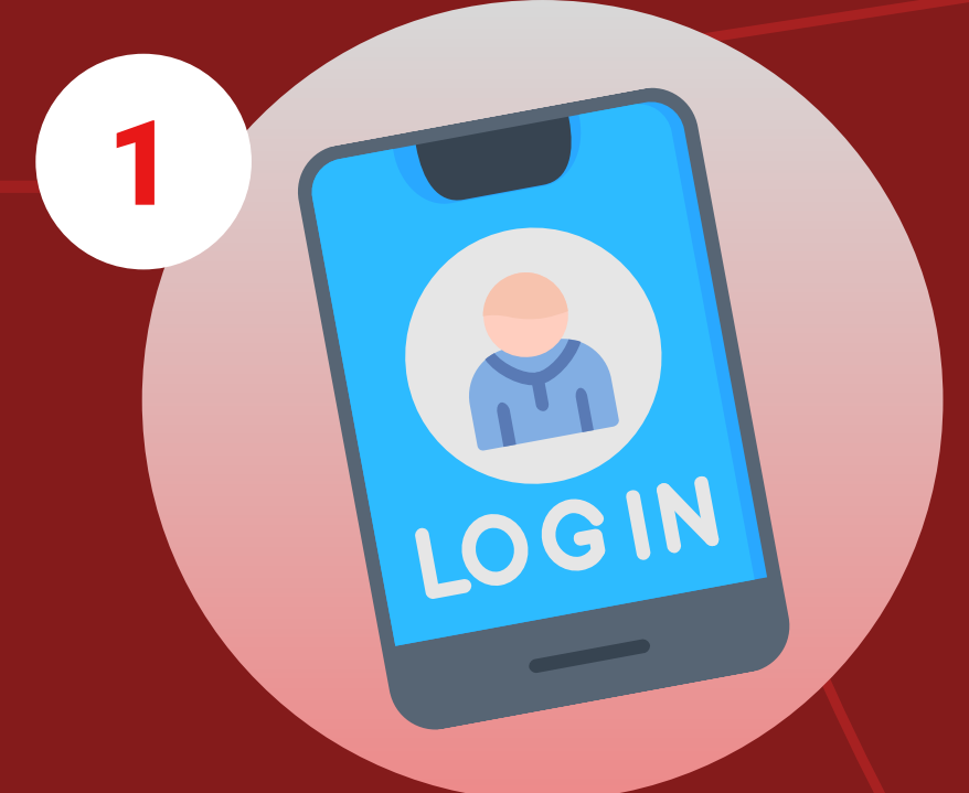
1 Đăng nhập