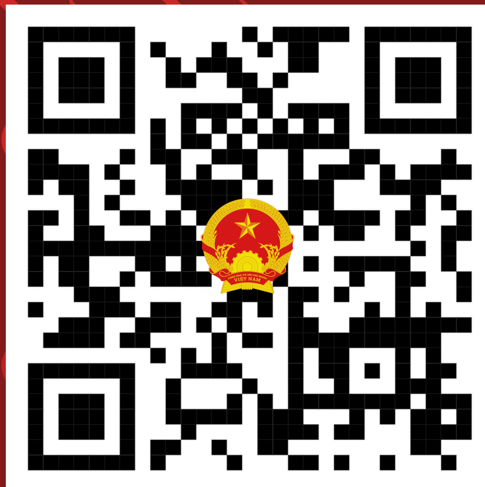
TRANG THÔNG TIN ĐIỆN TỬ PHƯỜNG THANH XUÂN