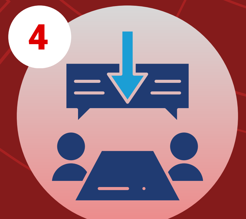
4 Nhận kết quả