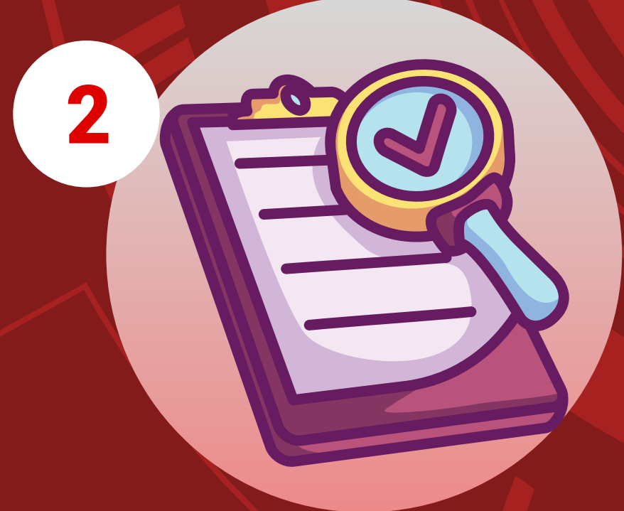
2 Nộp hồ sơ