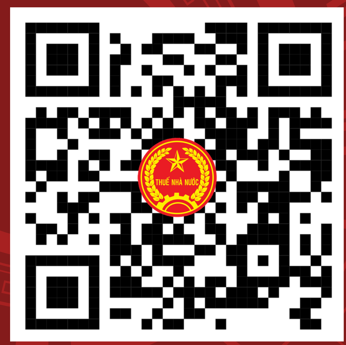
HƯỚNG DẪN SỬ DỤNG ỨNG DỤNG ETAX MOBILE