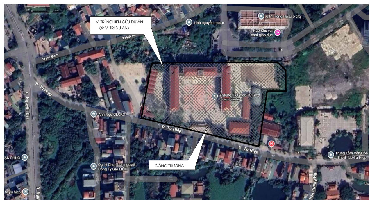
VỊ TRÍ KHU ĐẤT THEO BẢN ĐỒ VỊ TINH