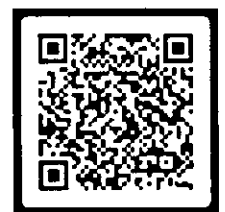
QR 2 Khảo sát

HÃY BẮT ĐẦU CHUYỂN ĐỔI NGAY HÔM NAY! CƠ QUAN THUẾ LUÔN ĐỒNG HÀNH, HƯỚNG DẪN, HỖ TRỢ!