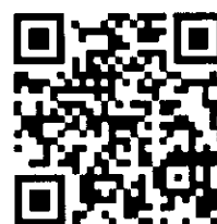
QR 1 Tài liệu

Quét mã [QR 2] để điền Phiếu khảo sát, cung cấp thông tin, giúp cơ quan thuế hỗ trợ bạn kịp thời.